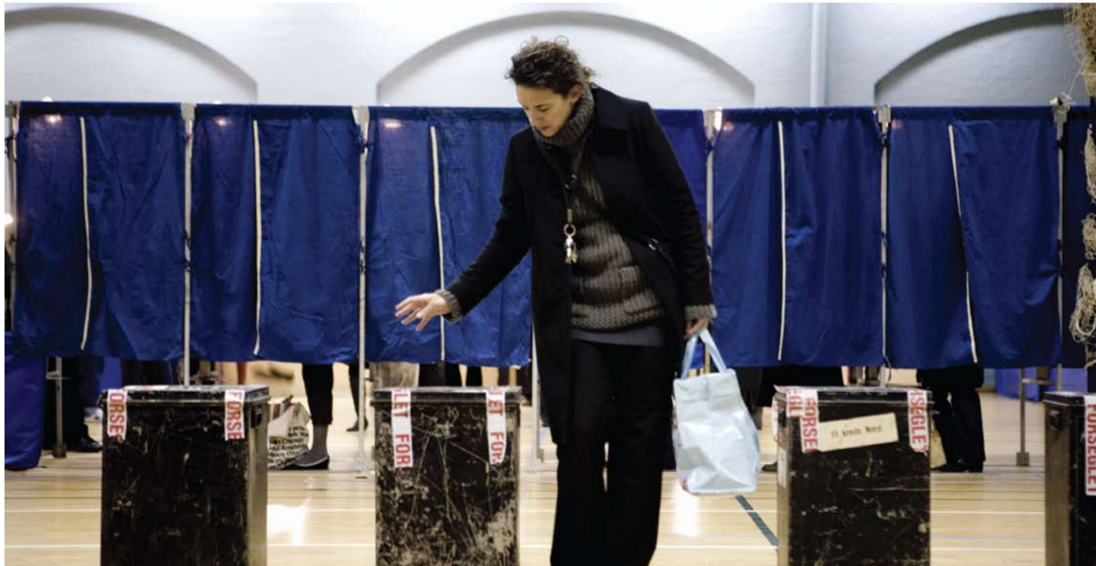
Radikale Venstre vil have de unge vælgere i tale ved Folketingsvalget.

Når startskuddet lyder til den kommende valgkamp, vil alle partier kaste sig ind i en vild kamp med det formål at erobre hinandens vælgere og hente stemmer hjem fra den anden blok. Men hvad med de danskere, som aldrig før har stemt? Hvordan får man fat i dem, der først nu er gamle nok til at træde ind i valgboksen?